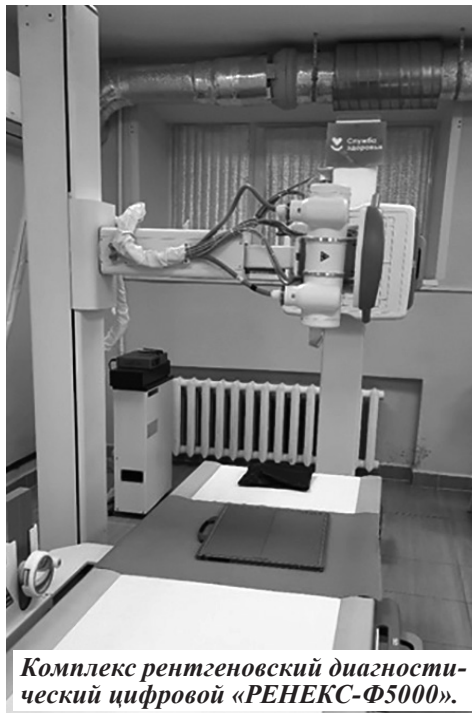
Комплекс рентгеновский диагностический цифровой «РЕНЕКС-Ф5000».

Кроме того, набор медоборудования Погарской ЦРБ дополнили диагностический гистероскоп; гистерорезектоскоп; аппарат