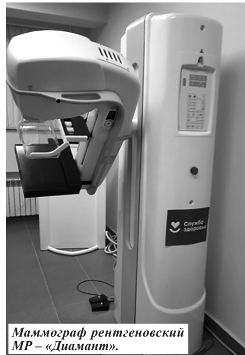
Маммограф рентгеновский МР – «Диамант».

– Важно, что программа продолжается. В этом году в распоряжении специалистов Погарской ЦРБ оказа-