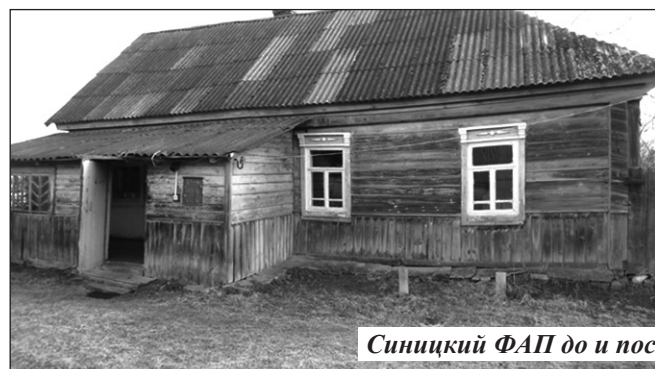
Синицкий ФАП до и после капитального ремонта.