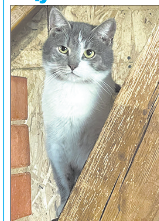
Кот Сокол. Ему 4 года, он привит и кастрирован.

Наша редакция и приют «Второй шанс» продолжают специальную рубрику. Вдруг среди опубликованных четвероногих обитателей приюта вы найдете свое счастье.